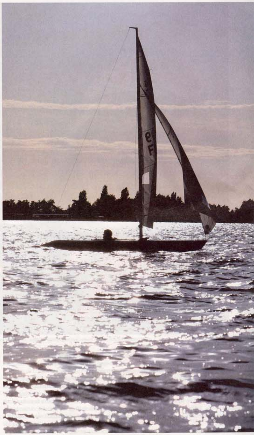
'Op het water, in mijn boot, vergeet ik alles en doe ik wat ik het leukst vind.'

Het is pijnlijk voor hem. "Maar ik ben al lang blij dat ik een beetje kan lopen en vooral dat ik het water op kan. Op het water, in mijn boot, vergeet ik alles en doe ik wat ik het leukst vind. Zeilen is mijn leven, dat ontnemt die dronken klootzak mij niet."