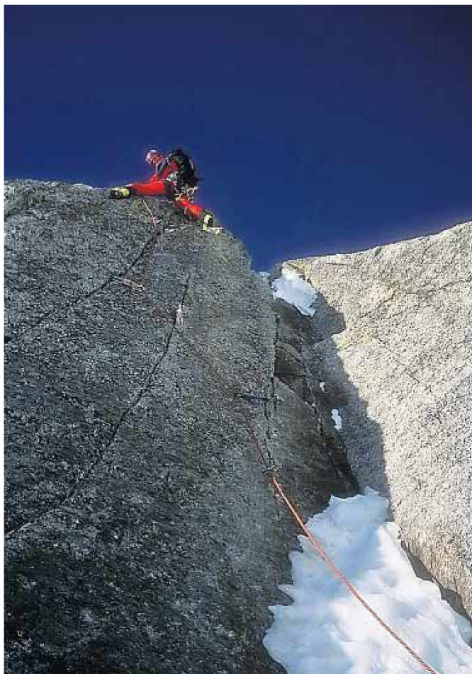
Thierry Schmitter als bergbeklimmer op weg naar de top.